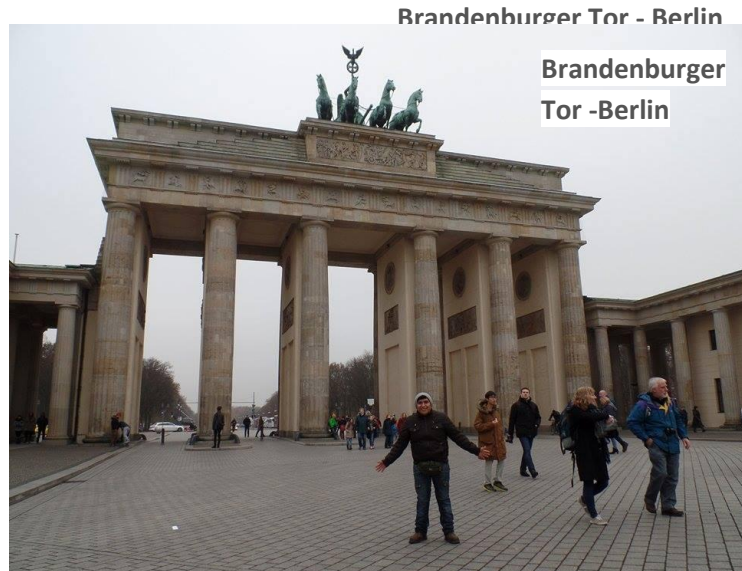
Brandenburger Tor - Berlin

un seminario en Berlín, en donde conocimos muchísimos más voluntarios de américa latina como de otros países; y en ese seminario se vieron temas de Política, religión, voluntarios y